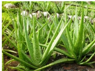
Gambar 34. Lidah buaya ( Aloe barbadensis )

Senyawa kimia yang terkandung dalam tanaman lidah buaya antara lain saponin, flavonoida, polifenol dan tanin. Bagian tanaman yang digunakan sebagai bahan pestisida nabati adalah daging daun. Ekstrak lidah buaya bersifat sebagai insektisida, bakterisida, dan fungisida. Selain itu, lidah buaya dapat digunakan sebagai perekat alami atau perata dalam aplikasi pestisida.