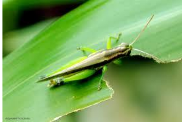
Gambar 9. Belalang

terlihat seperti terkoyak-koyak, terutama pada serangan parah yang bisa meninggalkan tulang daun saja.