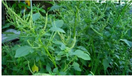
Gambar 19. Amaranthus spinosus ( https://potensibisnis.pikiran-rakyat.com/news/pr-69670249/ )

Bayam duri diketahui mengandung beberapa senyawa kimia, yaitu amarantin, rutin, spinasterol, hentriakontan, tanin, kalium nitrat, kalsium oksalat, garam fosfat, zat besi, serta vitamin. Bagian yang digunakan sebagai pestisida nabati adalah daunnya. Ekstrak daun bayam duri merupakan salah satu agen penginduksi ketahanan sistemik tanaman cabai merah terhadap serangan Cucumber Mosaik Virus (CMV) dan virus kuning Gemini.