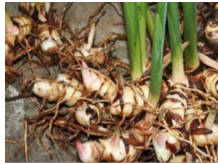
Gambar 33. Lengkuas ( Alpinia galanga )

Rimpang lengkuas mengandung lebih kurang 1 persen minyak essential terdiri atas metil–sinamat 48 persen, sineol 20 sampai 30 persen, eugenol, kamfer 1 persen, seskuiterpen, d – pinen, galangin, galanganol dan beberapa senyawa flavonoid. Bagian tumbuhan yang digunakan sebagai pestisida nabati adalah rimpangnya. Ekstrak rimpang lengkuas bersifat sebagai fungisida (anti jamur).