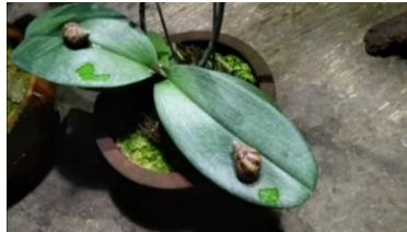
Gambar 10. Bekicot ( https://agrokomplekskita.com/hama-siput-pada-anggrek/ )