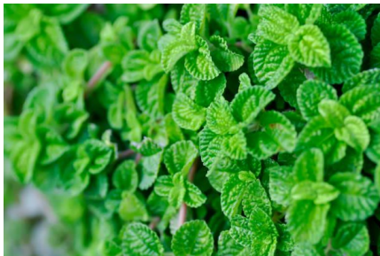
Gambar 20. Mint ( Mentha spp.)

Tumbuhan ini diketahui mengandung beberapa senyawa kimia, yaitu spearmint, flavonoid, tannin, menthol, menthone dan carvone. Bagian yang digunakan sebagai pestisida nabati adalah daun. Ekstrak daun bijanggut bersifat sebagai bakterisida.