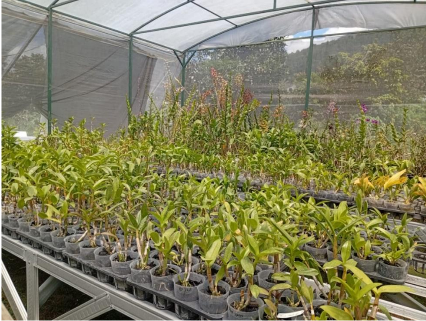
Gambar 2. Nursery anggrek Pabongan Orchid Desa Berjo, Kecamatan Ngargoyoso, Kabupaten Karanganyar, Propinsi Jawa Tengah